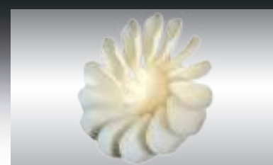
Точные результаты прессования, даже очень тонких реставраций.